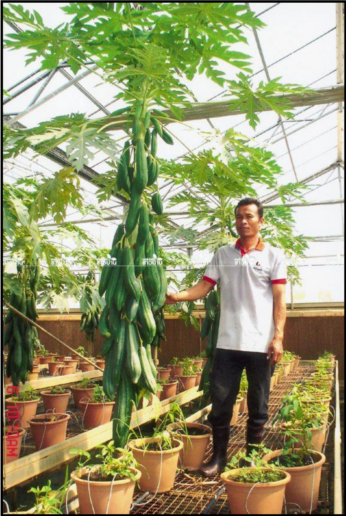
ผลมะละกอครึ่ง