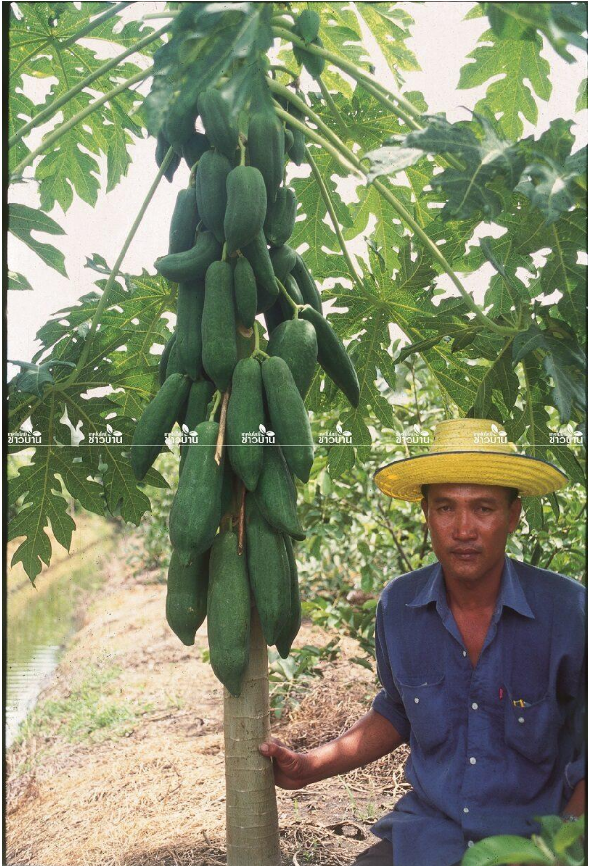
มะละกอแขกดำ-ดำเนิน